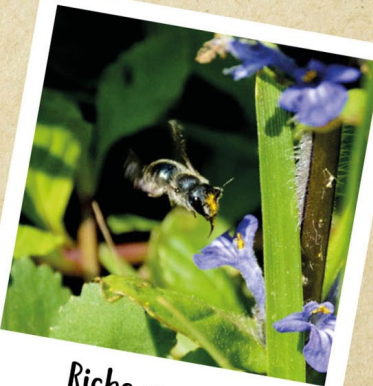
Riche en nectar