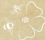
Réseau Biodiversité pour les Abeilles