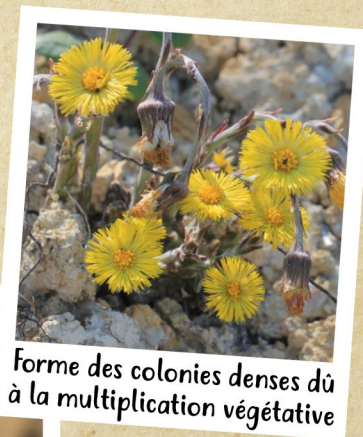
Forme des colonies denses dû à la multiplication végétative