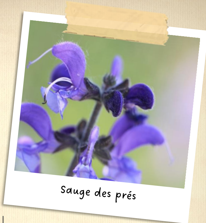
Sauge des prés