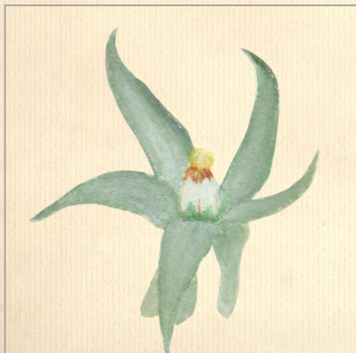
Coupe longitudinale de la fleur

1 pistil surmonté d'un seul style et d'un seul stigmate creusé en entonnoir