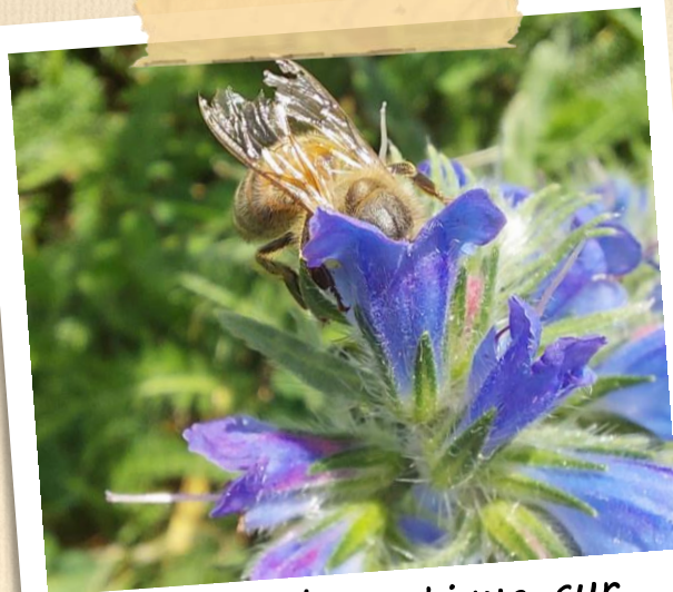
Abeille domestique sur Vipérine commune

Fleurs regroupées en grappes axillaires le long de la tige